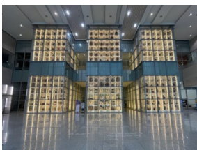
国立民俗博物館坡州 開かれた収蔵庫(タイプ1)