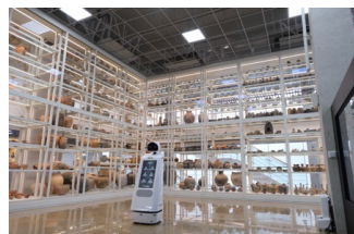
国立公州博物館 2階第10収蔵庫(タイプ1)