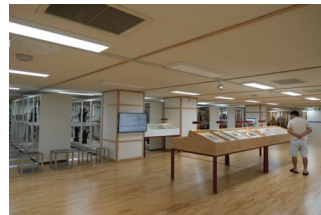
国立現代美術館清州 4階特別州倉庫(タイプ1、2)